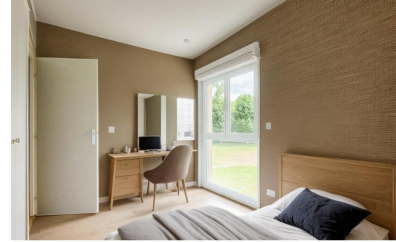
Aménagement proposé par une IA - Photo non contractuelle